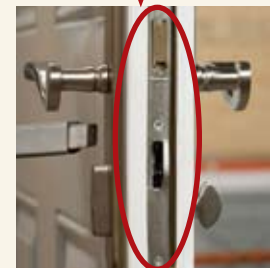
Porte standard avec serrure multipoint N'A PAS RÉSISTÉ