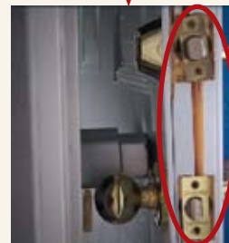
Porte standard avec pêne dormant N'A PAS RÉSISTÉ